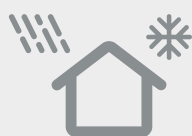
Table d'intérieur, non résistante aux intempéries